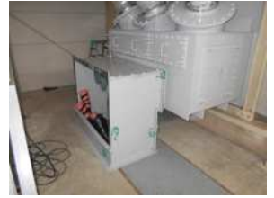
④既設ケーブルとの接続