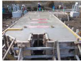
②コンクリート打設