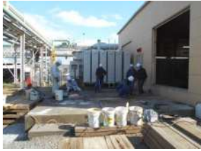
①既存建屋との取り合い