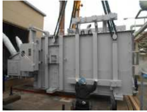
②変圧器搬入・据付