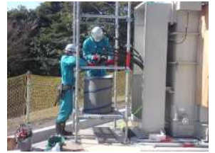
④ケーブル敷設、接続